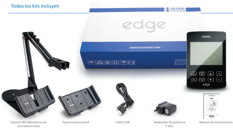
Soporte de sobremesa con portaelectrodos