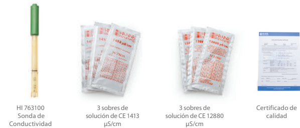
HI 763100 Sonda de Conductividad

El edge CE kit HI 2030-01 (115V) y HI 2030-02 (230V) incluyen: