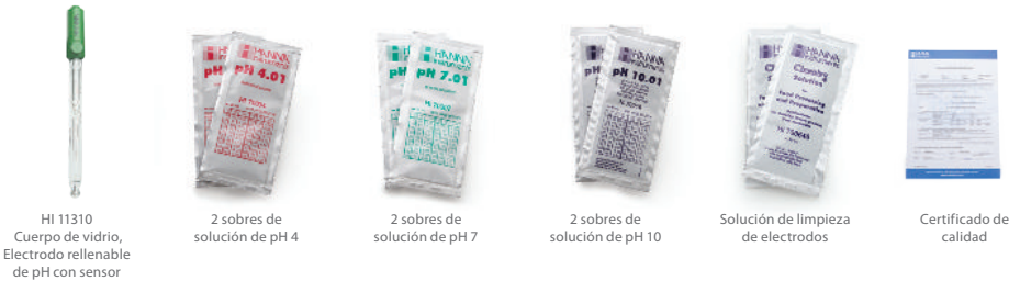
HI 11310 Cuerpo de vidrio, Electrodo rellenable de pH con sensor

El edge pH kit HI 2020-01 (115V) y HI 2020-02 (230V) incluyen: